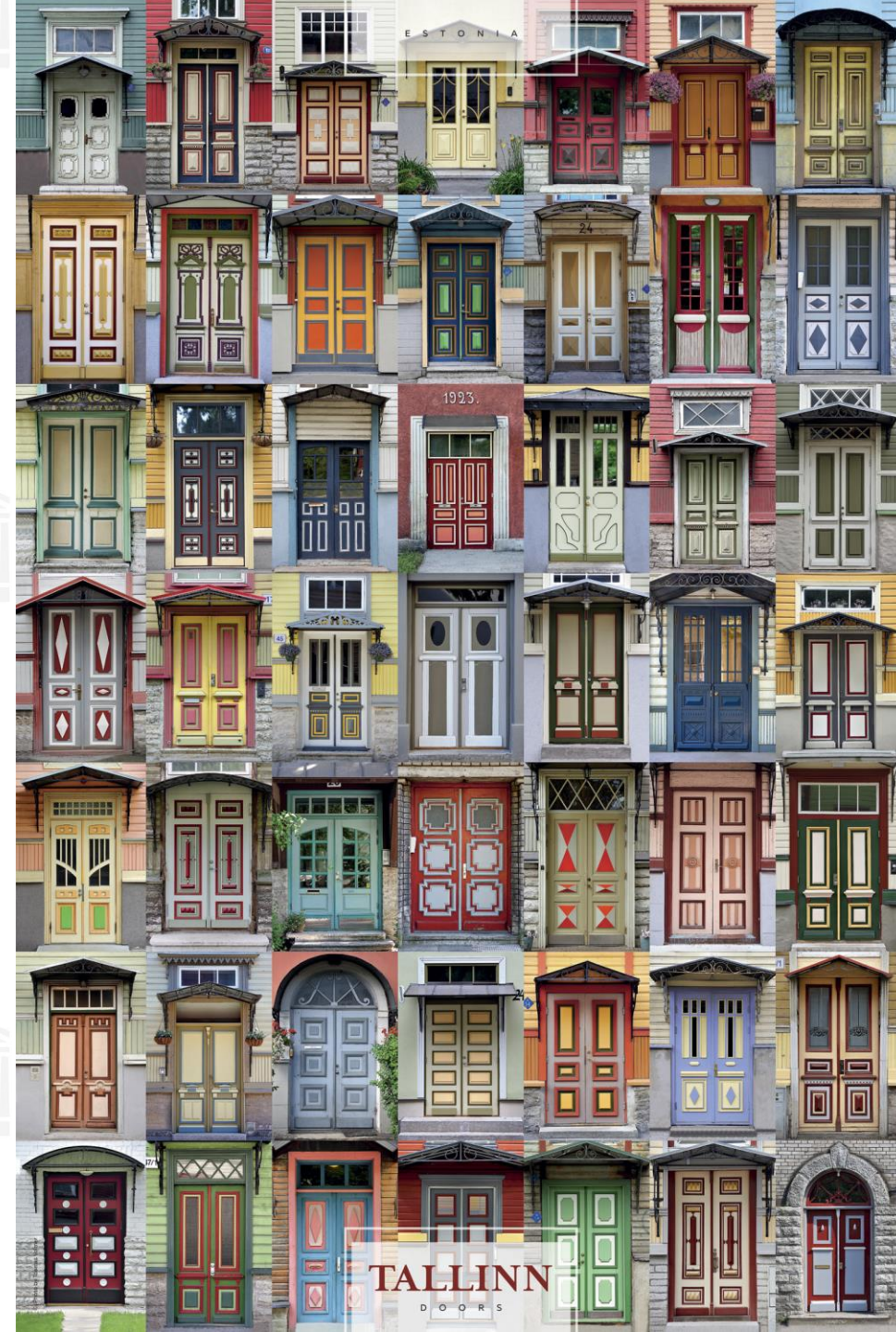
plakat TALLINNA UKSED by Toomas Voimer