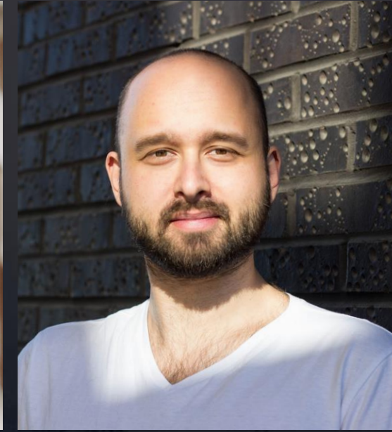
MARKETING MANAGER OF BEAMLIN ACCELERATOR