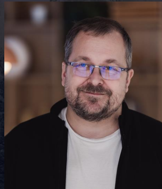
CO-FOUNDER & CFO OF BEAMLIN ACCELERATOR