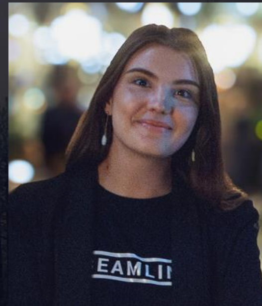
BRAND & COMMUNITY MANAGER OF BEAMLIN ACCELERATOR