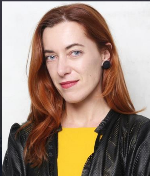
CEO OF BEAMLIN ACCELERATOR