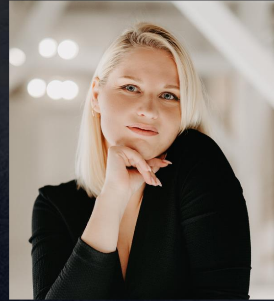
PROJECT & EVENTS MANAGER OF BEAMLIN ACCELERATOR